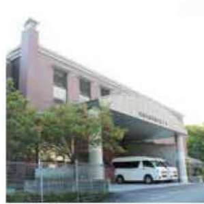
●高山村デイサービスセンター 群馬県吾妻郡高山村中山3410