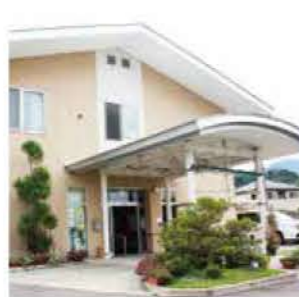
●グループホーム月夜野の里 ●月夜野の里デイサービスセンター 群馬県利根郡みなかみ町真庭363