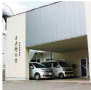
●小規模多機能月夜野の里 群馬県利根郡みなかみ町真庭308-1