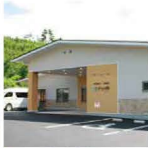
●地域密着型特養中山の郷 群馬県吾妻郡高山村中山2715-11