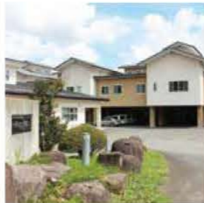
●特別養護老人ホーム西嶺の郷 群馬県利根郡みなかみ町西峰須川472-1