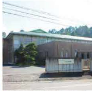
●介護老人保健施設りんどうの里 群馬県吾妻郡高山村中山2715-2