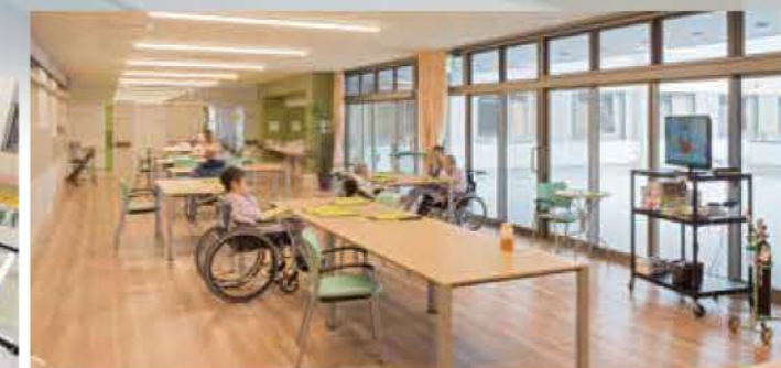
●広くて明るい食堂兼機能訓練スペース