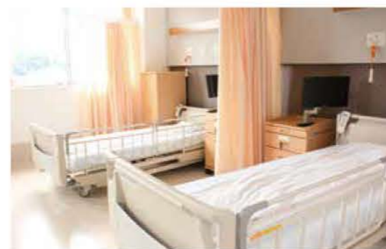
●明るく眺めの良い病室