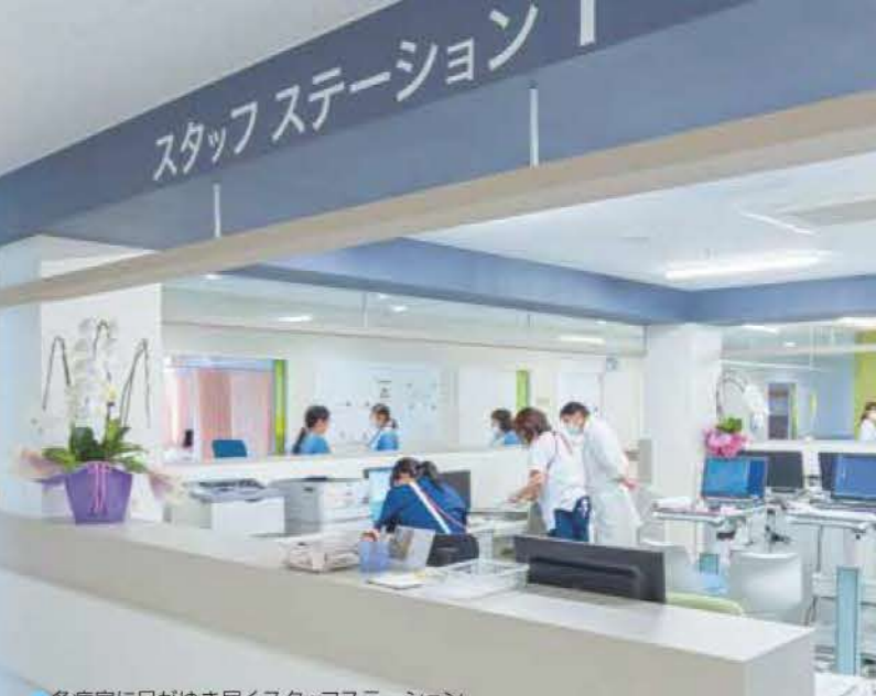
●各病室に目がゆき届くスタッフステーション