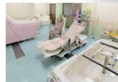
●3つのタイプの高機能機械浴槽を完備